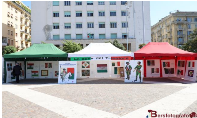
La Spezia - La Casa del Tricolore a P.zza Europa