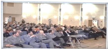
Sala Consiliare della Provincia, conferenza di Pietro Mennea.

5 OTTOBRE 2007 - SALA CONSILIARE DELLA PROVINCIA Conferenza dibattito del dott. Pietro Mennea sulla droga nello sport