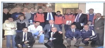
Foto ricordo con le Fiamme Cremisi.