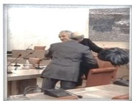
Il presidente del C.O. consegna il Cappello Piumato a Pietro Mennea.

Un'incursione nel mondo dello sport, quella dell'incontro dibattito con Pietro Mennea, il Presidente Onorario delle Fiamme Cremisi. Gremite l'auditorium della Giunta della Provincia di Pordenone. Il tema di attualità "la droga nello sport", da un lato ci ha fornito lo spunto per presentare l'ultimo lavoro del simbolo delle Olimpiadi Moderne, per altro verso ha voluto sottolineare un simpatico gemellaggio tra l'atleta che ha fatto della corsa una religione e i bersaglieri, che della corsa sono gli interpreti più genuini nell'immaginario collettivo degli italiani. La consegna del cappello piumato da parte del Presidente del Comitato Organizzatore a "Pietro il grande", e la sua professione di fede al "bersaglierismo" hanno sancito questo assioma. Simpatico il dopo cena con il Presidente della Provincia